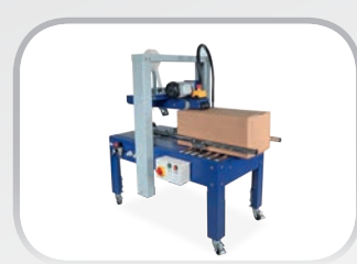
ROBOTAPE Nastratrici Taping machines

La certificazione ISO 9001 ottenuta già dal 1997 e da allora continuamente rinnovata, ha rappresentato non solo il raggiungimento di un traguardo prestigioso ma, soprattutto, ha rafforzato l'impegno dell'azienda a migliorare continuamente le proprie performance.