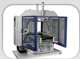
ORBIT Avvolgitori orizzontali Horizontal wrapping machines