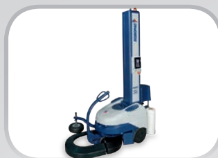
ROBOT Robot semovente Self-propelled robot

ROBOPAC's production range in packaging with stretch film is based on the following types of machines: