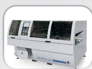
ATHENA Confezionatrici automatiche Automatic packaging machines