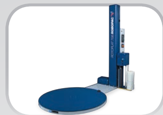
ROTOPLAT Avvolgitori a tavola rotante Turntable wrapping machines