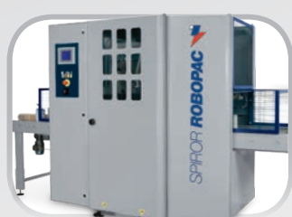
SPIROR Avvolgitori orizzontali Horizontal wrapping machines